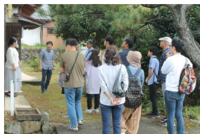
佐濃地区での移住者確保に向けたツアーの様子

指定を受けたことで、先行する町内他地区と同じく、川上地区でも移住者増加や空家・耕作放棄地の利活用を積極的に推進することで、更なる地域活性化へつなげる取組みを進めていきます。今後、指定地区での調査や協議を行うことがあると思いますが、皆様のご理解、ご協力をお願いします。