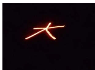
クミナリエ（大文字点灯）

また、12月29日（日）～1月2日（木）にかけて、除夜の鐘めぐり実行委員会による「久美浜一区除夜の鐘めぐり&お寺のライトアップ」が、如意寺、長明寺、本願寺、宗雲寺の4寺院を会場に開催され、多くの人出で賑わいました。