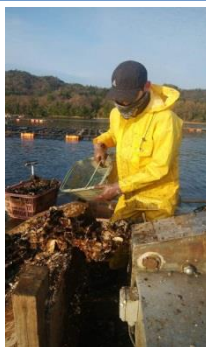
カキ水揚げ作業中

ある日、ご近所の方から「海に赤イカがいるよ。」と聞き、夕闇迫る薄暗い中、バケツ片手に海岸に行くと、1mはありそうな赤イカがいるではありませんか！その大きさに若干の恐怖を感じながらも、一人で食べきれないんじゃないイカ？と思えるイカを持ち帰りました。さっそく、切り込みを入れ、醤油に漬け込み「屋台風イカ焼き」にいただきました。