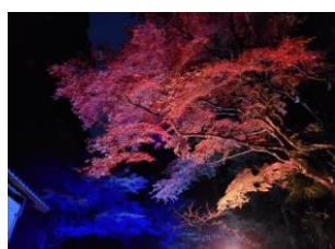
ライトアップの様子（宗雲寺）